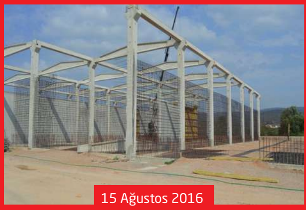
15 Ağustos 2016