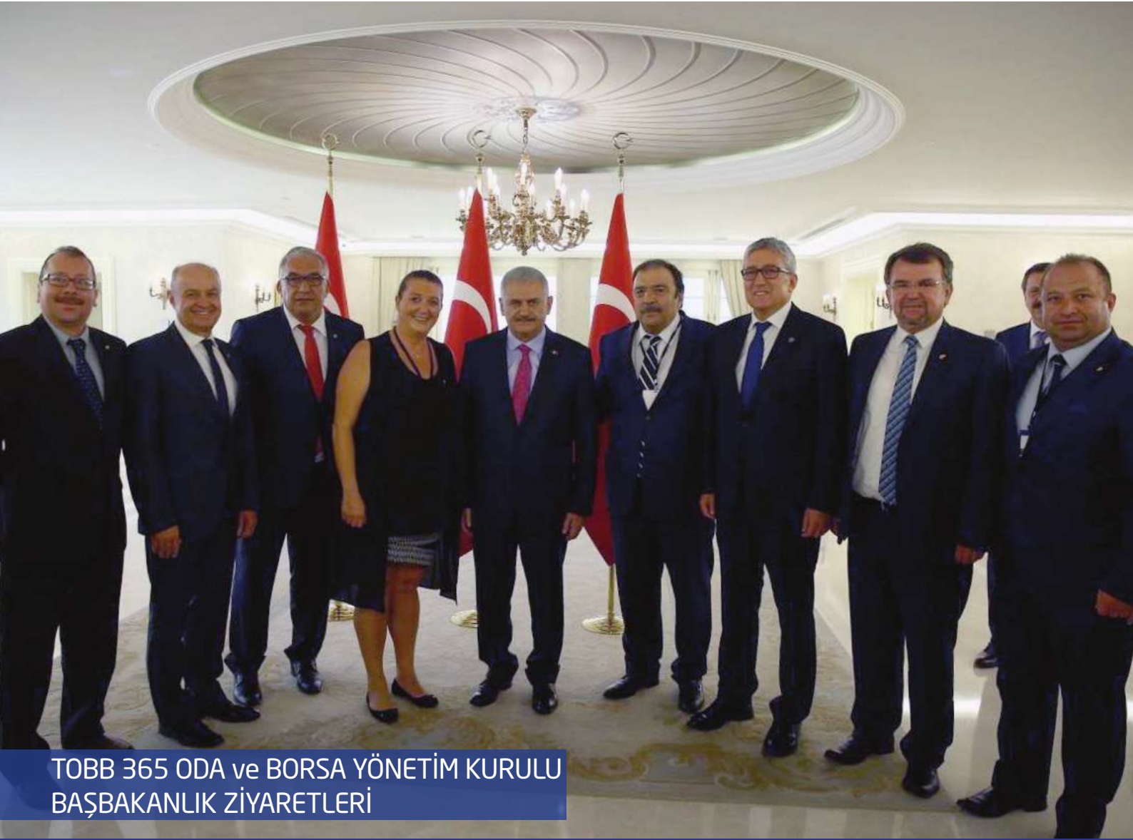
TOBB 365 ODA ve BORSA YÖNETİM KURULU BAŞBAKANLIK ZİYARETLERİ