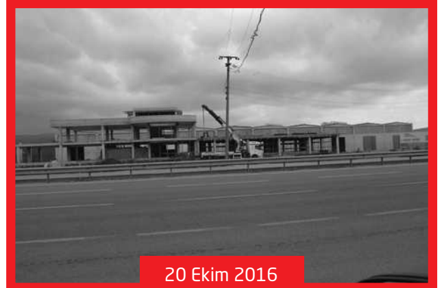
20 Ekim 2016