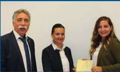
Susurluk Ticaret Borsası TS EN ISO 9001:2015 Kalite Yönetim Sistemi İç Tetkik Eğitimlerine Katıldı