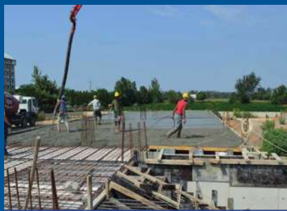
Susurluk Ticaret Borsası İnşaatı Hızla Devam Ediyor