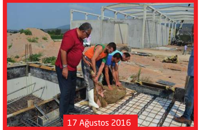
17 Ağustos 2016