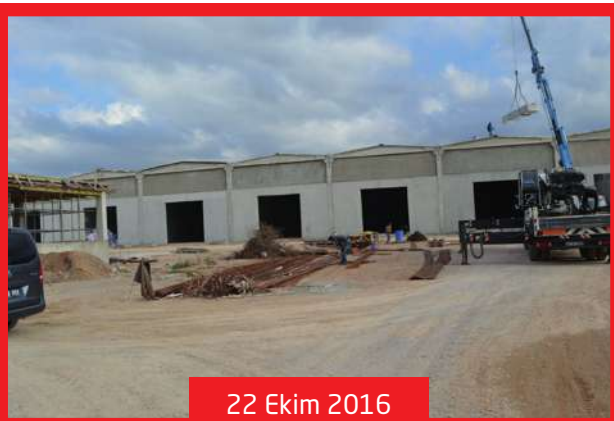
22 Ekim 2016