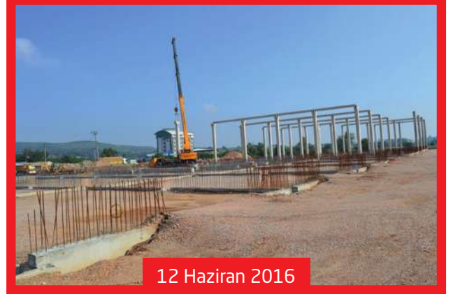
12 Haziran 2016