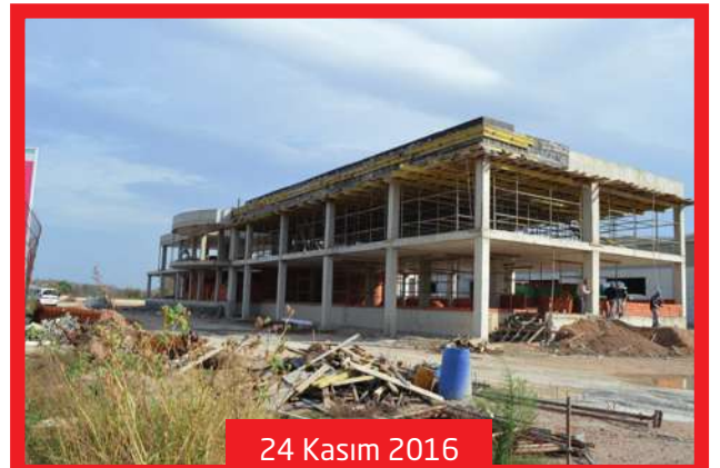
24 Kasım 2016