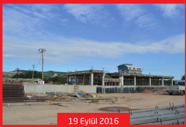
19 Eylül 2016