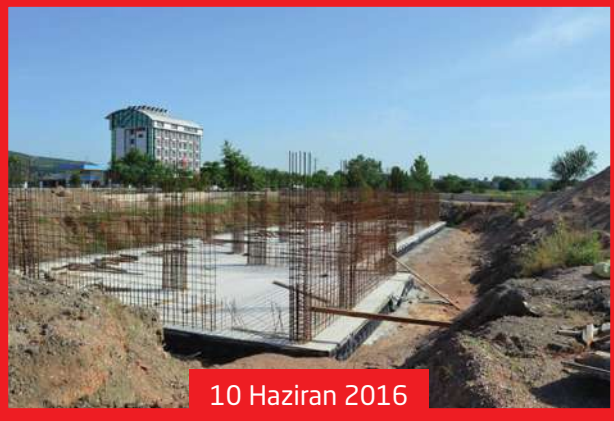
10 Haziran 2016