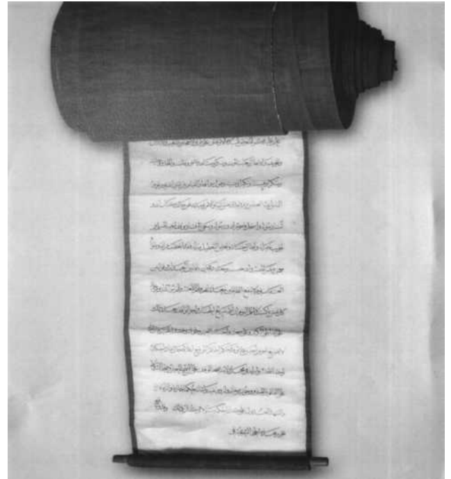
Fatih Sultan Mehmed Han Hazretleri'nin Ayasofya Camii'ne ait ceylan derisine yazılmış vakfiyesi. (M.1490). 65,30m.

Tapu sicilinde işlem yapmak isteyenler, bizzat veya vekilleri (temsilcileri) varsa vasi, kayyum ve Kanuni temsilcileri vasıtasıyla talepte bulunurlar. Tapu Müdürlüğünde yapılan işlemler taşınmaz mallara yönelik olmak üzere üç yönlüdür.