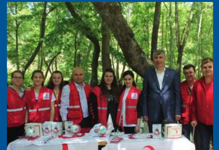
Türk Kızılayı Susurluk Şubesi SUSURLUK ŞUBESİ