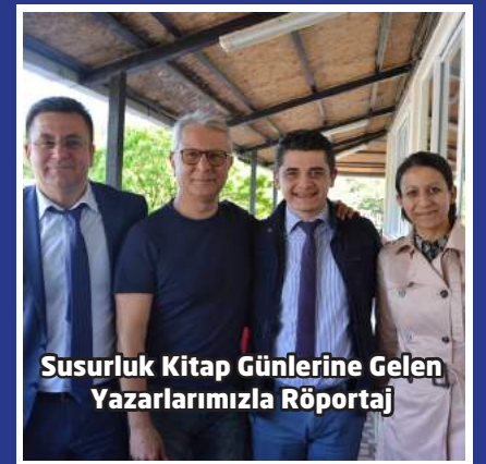
Susurluk Kitap Günlerine Gelen Yazarlarımızla Röportaj