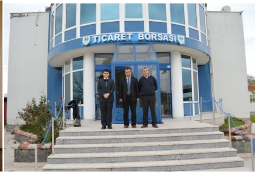
MUSTAFAKEMALPAŞA TİCARET BORSASI ZİYARETİ