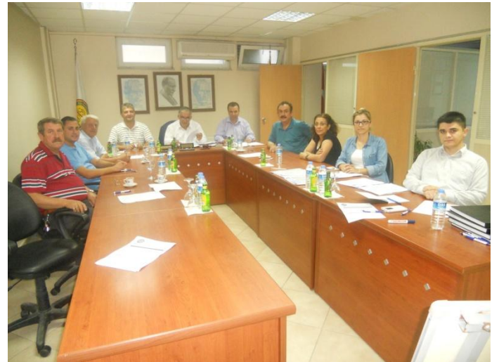
İÇ PAYDAŞ TOPLANTISI

Borsa Meclis Üyeleri ve personeli ile Borsa Meclis Toplantı Salonunda "İç Paydaş Toplantısı" gerçekleştirildi. Borsamız Akreditasyon sürecinden bahsedilerek, iç paydaşlarımız tarafından doldurulan anketler, yapılan SWOT Analizi çalışmaları ile kurumumuzun güçlü- zayıf yönlerini, fırsat ve tehditleri üzerinde konuşularak, belirlendi.