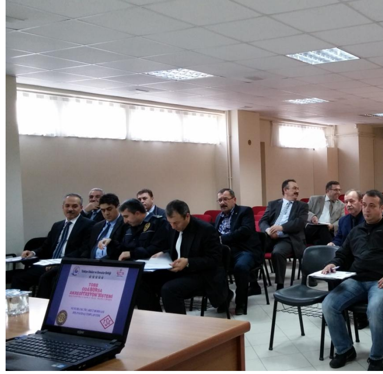
DIŞ PAYDAŞ TOPLANTISI

Borsamız Akreditasyon İzleme Komitesi Başkanlığınca organize edilen, 2014-2017 yılı Stratejik Planımızı düzenlerken Dış Paydaşlarımızın Kurumumuzu ne ölçüde tanıdıklarını anlamaya yönelik dış paydaş toplantısı 24 Ekim 2014 Tarihinde Ticaret Odası Şerafettin Tunalı Toplantı salonunda yapıldı. Toplantıya İlçemiz Resmi Kurum Müdürleri , Sivil Toplum Kuruluş Başkanları ve yetkilileri, Balıkesir Ticaret Borsası ve GMKA ile ilçemiz basın temsilcileri katıldı.