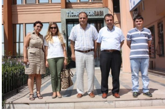
BANDIRMA TİCARET BORSASI ZİYARETİ