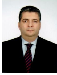
Hüseyin TUNALI Meclis Başkanı