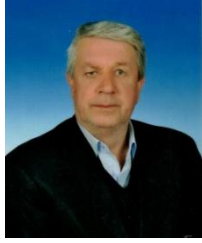
Yakup BOZKAN Hesapları İnceleme Komisyonu Başkanı