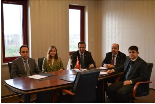
KARACABET TİCARET BORSASI ZİYARETİ